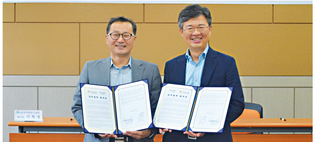
(재)전남바이오산업진흥원 천연자원연구센터가 최근 ㈜팜스빌과 공동 협력 업무협약을 맺었다.

목포시는 입장문을 통해 “체육인과 시민께 송구하다는 말씀을 드린다”면서 “이번 일을 반면, 교사로 삼아 보조금을 지급받는 산하 모든 단체와 소속 임직원의 각종 부정행위는 일벌백계의 원칙으로 단호하게 대처하겠다”고 밝혔다. /목포=박승경 기자