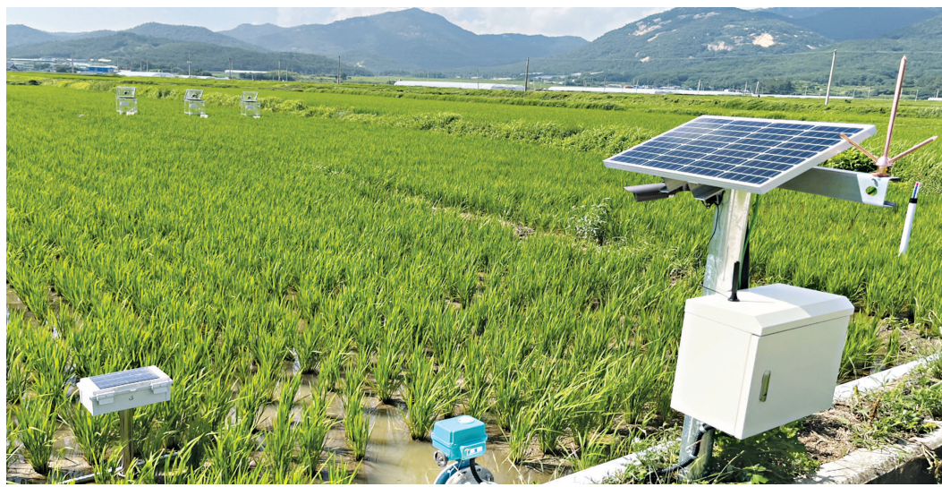
해남군이 저탄소 벼 논물관리 기술보급 시범사업을 본격적으로 실시하고 있다.

영상 자동물꼬장치 도입 추진 온실가스 감축·농업용수 절약 관련 교육·실무협의회 개최도