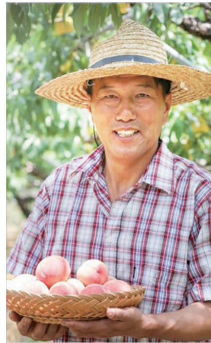
해충방제, 초생재배 등 유기농 복숭아 재배를 위한 다양한 노력을 인정받아 전

남도 지정 유기농 명인 제24호로 선정됐다. 2019년에는 농식품부의 농업마이스터로 지정돼 친환경 과수분야에 대한 전문 기술과 지식을 후배들에게 전수하고 있으며, 2018년에는 전국친환경농산물 유기농품평회에서 금상을 받아 농축산식품부장관을 수상하기도 했다.