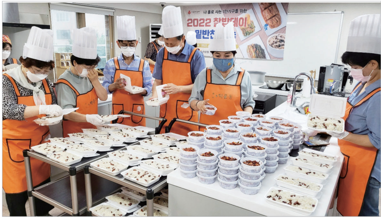
학운동 지사현, 찰밥데이 행사

광주시 동구 학운동 지역사회보장협의체(위원장 정춘남)와 행정복지센터(동장 서주섭)는 21일 사랑채 공유부락에서 관내 1인가구 어르신들의 식생활 안정화를 위해 찰밥데이 행사를 갖고 찰밥도시락과 낙지젓 무침, 조리김 등 밀반찬 120개를 정성스럽게 만들어 전달했다.