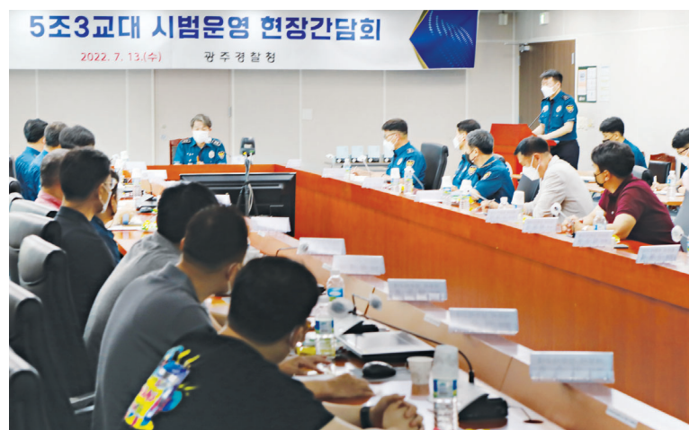
광주경찰청, 5.30교대 현장간담회 광주경찰청은 13일 광주경찰청 무등홀에서 상무지구대, 수완지구대 현장직원 등 30여명이 참석한 가운데 5.30교대 현장간담회를 개최했다.