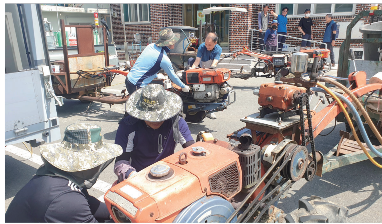
전남도농업기술원, 농기계 순회 수리 강진군 3개 읍면 오지 지역에서 농기계 순회 수리에 나선 전남도농업기술원(원장 박홍재)과 강진군농업기술센터가 지난 5일부터 7일까지 군 동면 신기마을회관 등에서 농기계 수리를 하고 있다.