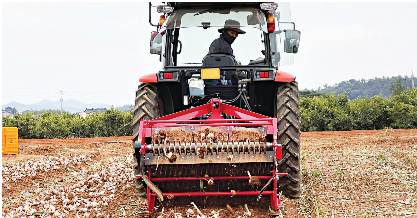
무안군은 최근 현경면 현하리 시범포장에서 관계자 50여 명이 참석한 가운데 시범사업 목적과 추진상황, 주요 농기계 설명과 함께 트랙터 부착형 마늘 줄기절단기와 땅속작물 수확기를 이용한 시연회를 개최했다.

진도 플럼코트는 지난 2017년 진도대과 대체작목으로 농가 보급을 첫 시작으로 3년째 수확 중이다.