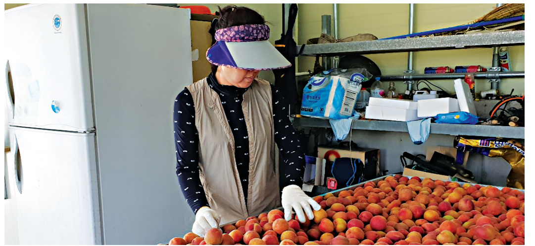
진도군에서 자두와 살구를 교배한 플럼코트 수확이 한창이다.

또, 향후 발주 예정인 전광판 및 각종 경기계측장비에 대해서도 우수자재로 시공해 품질을 확보할 계획이다. /목포=박승경 기자