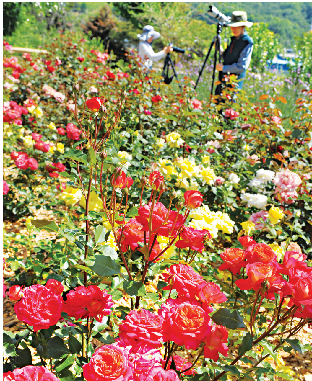
담양 '달빛여행정원' 장미꽃 만발

8일 담양 '달빛여행정원'에 장미와 벚꽃이 만발해 많은 사람들의 발길이 이어지고 있다. 담양군 대덕면 시목리에 있는 달빛여행정원은 4,140㎡ 부지에 형형색색의 아름다운 초화류와 수목 등 250여 종이 자태를 뽐내고 있다.