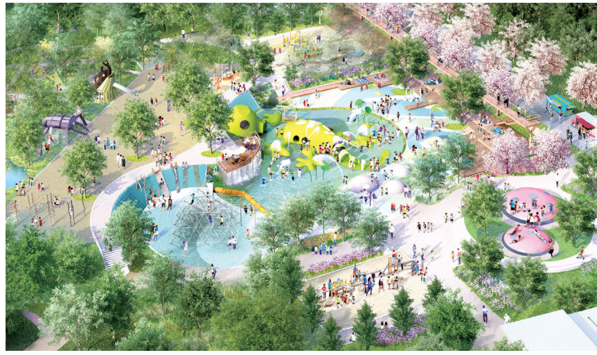
아시아 생태 예술 놀이정원 조감도

정원은 여름에 물놀이를 할 수 있는 도농농 물놀이장을 중심으로 다양한 놀이 공간을 마련하고, 가족 단위 시민들이 함께 이용할 수 있도록 휴게 데크, 파고라,