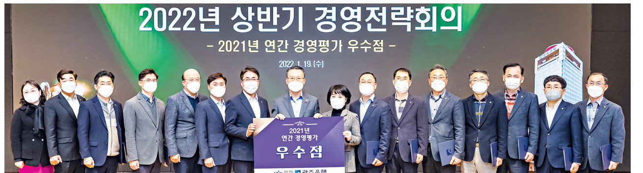
광주은행은 19일 본점 3층 KJ상생마루에서 2022년 상반기 경영전략회의를 개최했다.

4대 실천과제는 ▲포스트 코로나 시대에 대응하기 위한 차별화된 미래 성장동력 확대 ▲지역 중소기업대출 중심 기반사업 확대를 통해 수익성 중심 내실