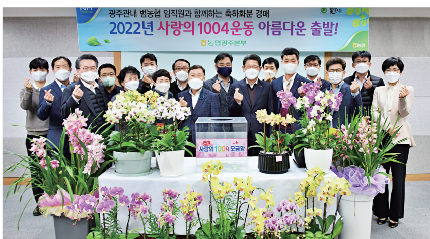
합한 광주지역 어려운 세대에 의료비로 지원될 예정이다.