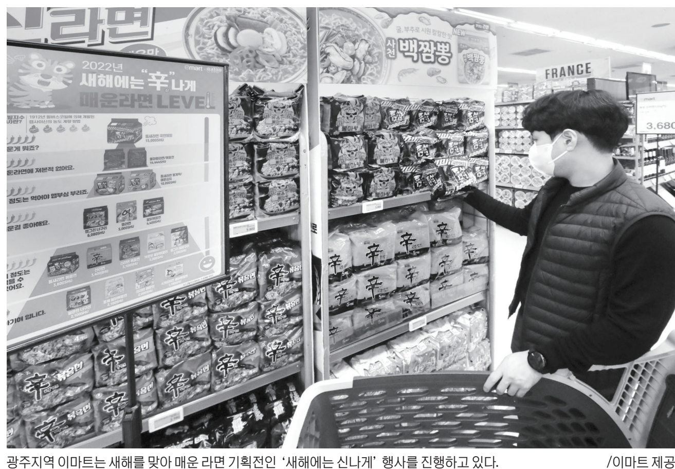
광주지역 이마트는 새해를 맞아 매운 라면 기획전인 '새해에는 신나게' 행사를 진행하고 있다.

했다. 현대차그룹은 새로운 시대의 고객 라이프 스타일에 부합하는 상품과 서비스를 제공하기 위해 전동화 상품의 핵심인 모터, 배터리, 첨단소재를 비롯한 차세대 기술 분야에서 글로벌 경쟁력을 확보한다는 계획이다. 이를 실행하기 위한 연구 개발, 생산, 판매, 고객관리의 전 영역에서 '전동화 체제로의 전환'을 적극적으로 추진한다. 올해는 아이오닉6, GV70 전동화모델, 니로EV, EV6 고성능 모델을 출시해 고객 선택의 폭을 확장할 계획이다. /황애란 기자