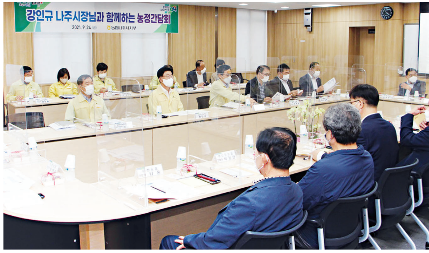
강인규 나주시장이 최근 농협중앙회 나주시지부 2층 회의실에서 농·축협 조합장과 농정간담회를 가졌다.

인 육성 ▲장조·신하 등 국산 품종 기반 조성 및 확대 등을 꼽았다. 또 지난 6월 농림축산식품부 주관 농촌협약대상지역(5년 간 국비 300억원 확보), 노후 된 미곡종합처리장(RPC) 통합 건립을 주요 내용으로 한 '2022년 고 품질 쌀 유통활성화사업'(국비 74억원 확보) 등 공모사업 선정 성과도 밝혔다. 조합장들은 간담회를 통해 ▲음·면별 농업분야 특색사업 발굴 지원 ▲벼 건조·저장시설(DSC) 설치 ▲나주배 명성 회복을 위한 품종갱신 사업 등 영농 현장의 요청 사항을 전달하고 적극적인 지원을 요청했다. 강인규 시장은 "코로나19 장기화 기운