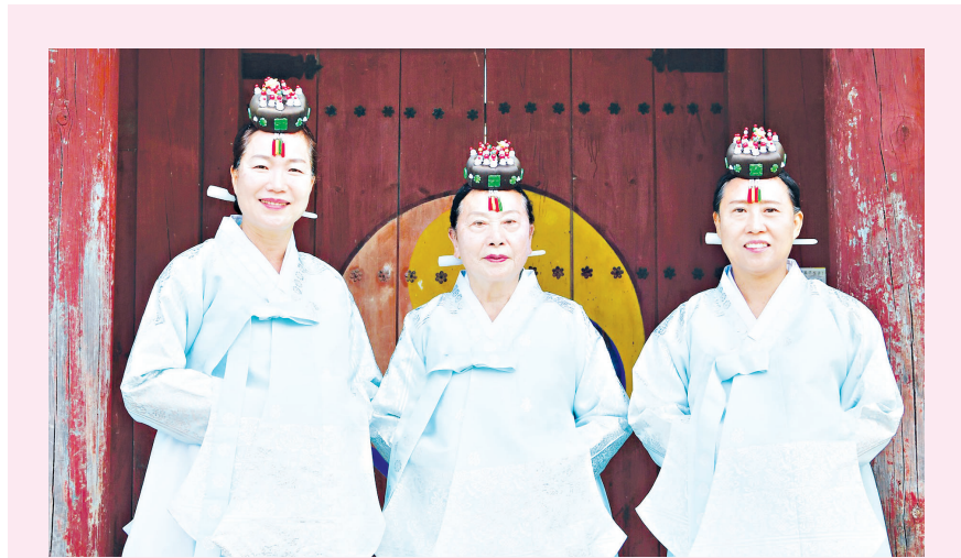
장성 봉암서원이 창건 이후 최초로 초헌·아헌·중헌관을 여성이 맡아 화제를 모았다. /장성군 제공

모든 프로그램은 코로나19 백신 2차접종 완료자에 한해 참여 가능하며, 보건전문요원들의 지도하에 방역수칙을 철저히 준수해 운영되고 있다. 프로그램에 참여 중인 한 군민은 "보건소 프로그램을 통해 스트레스도 해소하고, 다시 건강을 되찾아 너무 행복하다"며 "프로그램 운영에 많은 노력을 기울여 주는 영광군 보건소 직원들에게 감사드린다"고 말했다. /영광=곽승훈 기자