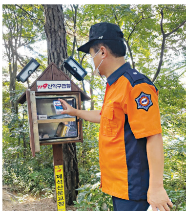
신고해야 한다”고 당부했다.