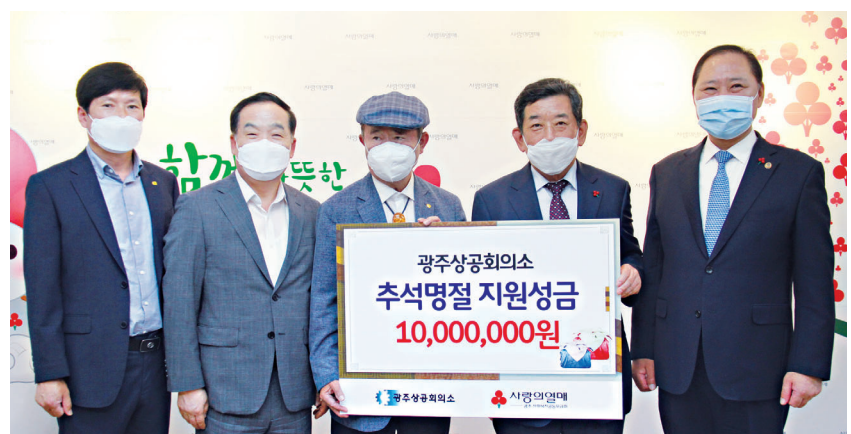
광주상공회의소는 최근 추석을 맞아 광주사회복지공동모금회에 1,000만원의 성금을 전달했다.

SPC 관계자 또한 “노조 간 갈등과 이권다툼에서 비롯된 문제를 회사와 가맹점들의 영업 등 생존권을 위협하며 해결하려는 화물연대의 파업을 사실상 ‘명백한 화물운송용역계약 위반에 해당’하는 이번 파업으로 인해 발생하는 피해에 대해 손해 배상을 청구하는 등 강력 대응할 것”이라고 말했다. /오지현 기자