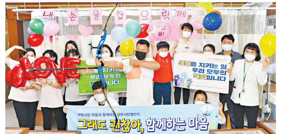
담양 탐통증연합회원이 2021년 생명사랑 챌린지 경연대회에서 최우수상을 수상했다.

장흥군 관계자는 "주민단체의 자발적인 참여와 사후관리에 적극적으로 임해 줄 것을 당부한다"며 "사업 시행 전 주민 의견 수렴 및 숲속의 전남 실무협의회의 자문을 받아 아름다운 명품숲이 조성될 수 있도록 노력하겠다"고 밝혔다. /장흥=이옥현 기자