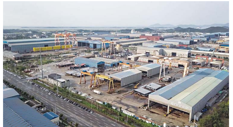
(주)보원엔앤피 생산시설 전경.