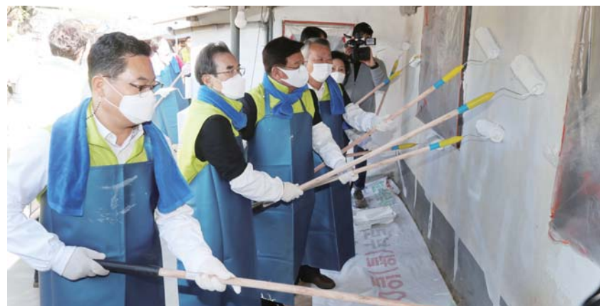
12일 해남군 고령 농업인 농가를 방문한 농협중앙회 이성희 회장과 참가자들이 노후 농가에서 페인트칠을 하고 있다.

마 대표는 “성실과 화합, 창조라는 경영이념을 지켜나가면서 혁신적인 기술개발을 통해 고객과 임직원 모두가 만족할 수 있는 경영을 추구해 나가겠다”고 강조했다. /박선욱 기자