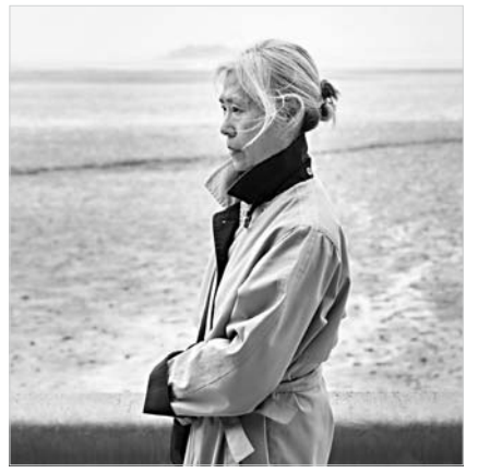
영화 '69세' 스틸컷.

'팔락'은 스페인에서 개봉하지 않은 올해의 가장 뛰어난 장편 영화를 소개하는 섹션으로, 지난해 그레예다 히로카즈 감독의 '파비안'에 관한 '진실', 셀린 시아마 감독의 '타오르는 여인의 초상', 봉