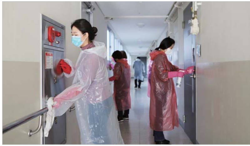
농성빛어울래종합복지관 아파트 소독 농성빛어울래종합사회복지관(관장 김건태)과 광주시사회복지사협회(회장 전성남)는 '2020년 코로나19 협력사업'을 진행, 지난 13일 농성빛어울래 아파트 단지에서 소독과 방역활동을 펼쳤다.