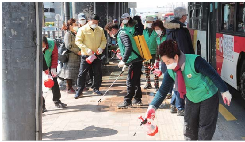
광천동새마을회 버스터미널 방역 15일 오후 광주시 서구 광천행정복지센터 관계자와 광천동새마을회 회원들이 광주 종합버스터미널 앞 시내버스 정류장에서 코로나19 예방 방역을 실시하고 있다. /김생훈 수습기자