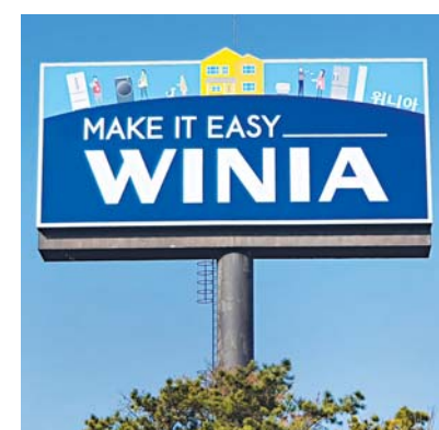
경부고속도로 청계산 부근 설치된 'MAKE IT EASY' 야립(野立)광고.

대우위니아그룹은 대표 종합가전 브랜드인 '위니아'로 위니아답채와 위니아대우 양 사의 시너지를 통해 국내를