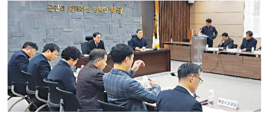
영광군은 최근 군청 소회의실에서 국고건의사업 발굴 보고회를 개최했다.

원의 영농정착 지원금을 지원한다. 신청은 농림사업정보시스템(www.agrix.go.kr)을 통해 온라인으로 접수하면 된다. 군 관계자는 “이번 사업은 장성 미래 농업 발전을 이끌어 갈 유망한 농업인과 청년농업인의 정착을 돕기 위한 사업”이라며 “세부적인 영농계획을 수립한 참신한 인재들의 많은 참여를 바란다”고 말했다. 사업신청에 자세한 내용은 군청 홈페이지 공지사항을 통해 확인하거나 농업기술센터로 문의하면 된다. /장성=전일용 기자