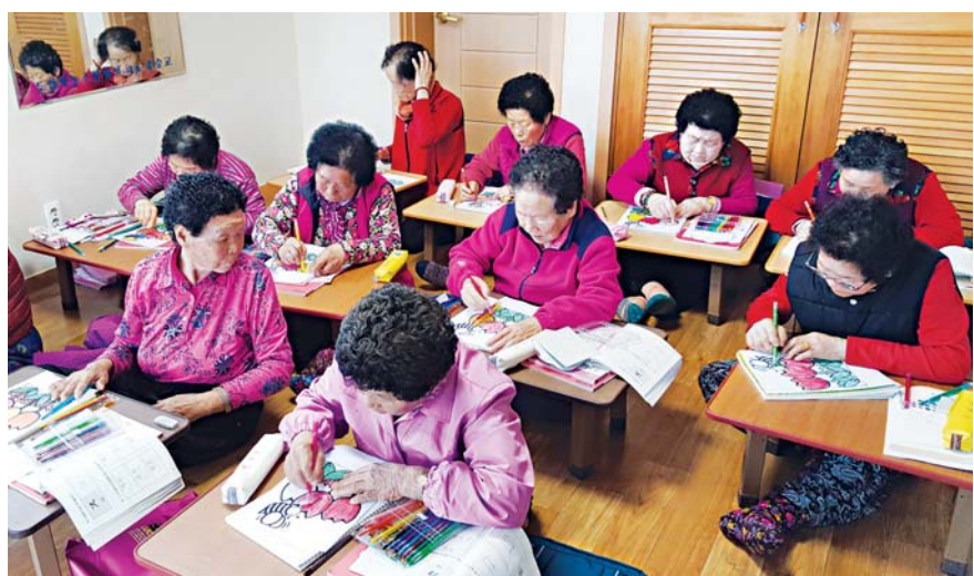
화순군이 배움의 기회를 놓친 어르신들을 대상으로 ‘마을로 찾아가는 문해교실’을 운영한다.

함평군농업기술센터가 수출 기반조성을 위해 수출전용 신품종 딸기 육묘장과 스마트 팜 시설을 구축한다. 함평군은 스마트팜 구축으로 환경에 민감한 딸기재배에 정밀한 환경제어를 도입해 고품질 딸기 생산과 농가소득 증대가 기대된다. 앞서 군은 최근 3년간 자가 고설 육묘 시설을 13개 농가에 지원했다. 지난해에는 활력화작목 기반조성사업비 9,000만원을 확보해 9개 농가 8,000㎡ 규모에 고설벤치 육묘시설, 고온예광 시설, 포트육묘 시설 등을 지원했다. 군은 나산면에 바이러스가 없는 조직배양묘 재배 전문 육묘장을 신규 설치하고 판로도 지역농협, 로컬푸드 직매장까지 넓혔다. 센터 관계자는 “기술보급과 기반시설 구축 등 딸기재배 농가에 지원을 아끼지 않겠다”고 말했다. /함평=윤예중 기자