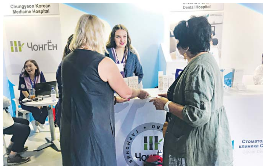
알마틴 청연은 최근 카자흐스탄 알마티 도스틱플라자 쇼핑몰 이벤트 홀에서 열린 의료관광 대전에 참여해 한의학을 알렸다.

그간 A씨를 지켜 본 정성택 교수는 “불편한 몸으로 자신의 건강을 챙기는 것도 쉽지 않는데 이렇게 어려운 아이들까지 배려하는 모습에 감동받았다”면서 “그의 꿈이 이뤄질 수 있도록 방글라데시 의료봉사도 계속 이어가면서 의료혜택을 제대로 받지 못하는 아이들을 위해 더욱 노력하겠다”고 밝혔다. /이나라 기자