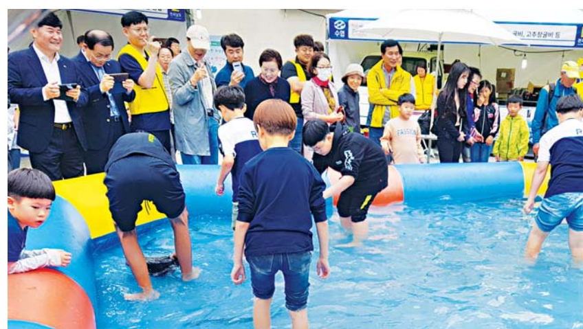
수협중앙회 전남본부가 최근 광주 충장축제장에서 개최한 '어식백세 전남 제철 수산물 직거래장터'에서 장어 맨손잡기 체험행사가 큰 인기를 끌었다.