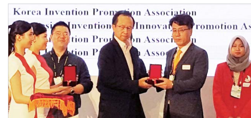
한국전력 광주전남본부가 최근 대만 타이베이 세계무역센터에서 열린 '2019대만 국제발명전시회'에서 금상을 수상했다.

'지능형 전력구 관리시스템'은 지난해 11월 발생한 서울KT 지하통신구 화재 등으로 사회기반시설에 대한 재난대비 시스템 보완 요구 목소리가 커지는 시점에 개발돼 효용 가치가 클 것으로 기대되고 있다. /서미애 기자