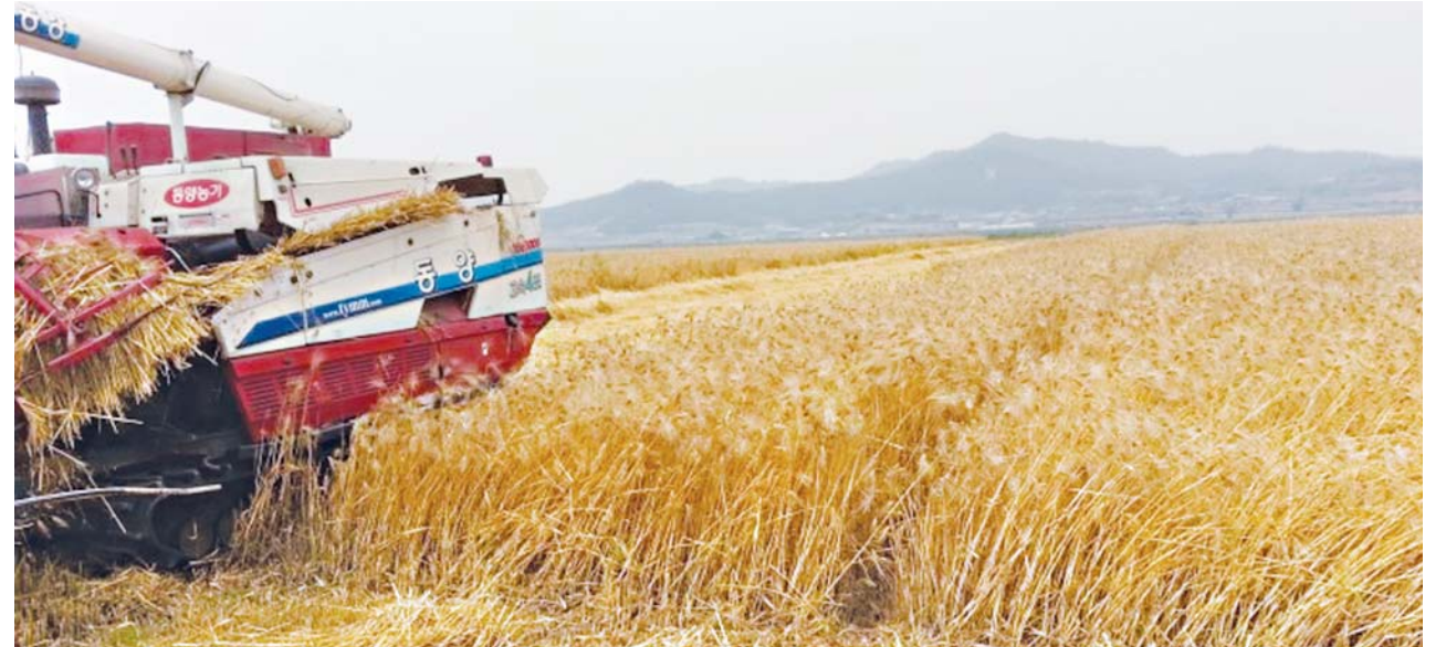
전남지역 보리 재배면적 감소에도 불구하고 생산량이 크게 늘면서 올해산 보리가격이 폭락했다.

지난해 321kg이었는데 올해는 457kg으로 무려 42%나 늘었다. 올해산 보리 20만t 중 연간 수요 12만~14만t 대비 6만~8만t이 과잉생산됐고, 이중 7만9,000t가량이 비계약 물량으로 추정된다. 보리는 농협을 통해 사전에 계약을 맺고 재배하는데 여기에 포함되지 않고 농가에서 자체적으로 재배한 물량이 비계약 물량이다. 비계약 물량도 수매하기는 하지만 계약물량보다 가격이 더 낮다. 주정용 쌀보리 40kg 가격의 경우 계약물량은 3만9,000원에서 3만7,000원으로, 비계약 물량은 3만5,000원에서 2만7,000원으로 23%나 폭락했다. 일부에서 계약, 비계약 물량간 가격 차이 축소를 요구하지만 과잉 생산 연례화, 공급과잉 심화 등에 대한 우려로 현