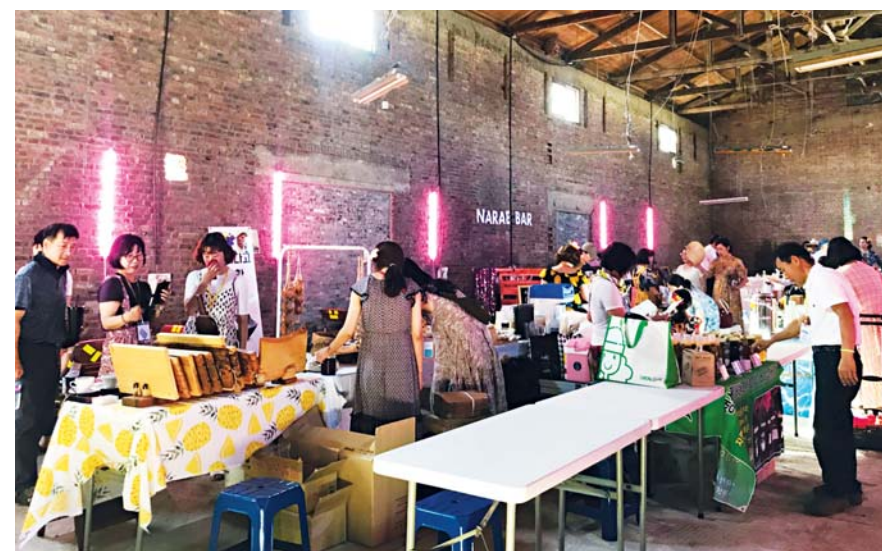
담양군은 최근 동진의원 옆 창고에서 '미드나잇 소프마켓'을 열었다.