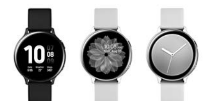
삼성 갤럭시 워치 액티브2 알루미늄 40mm