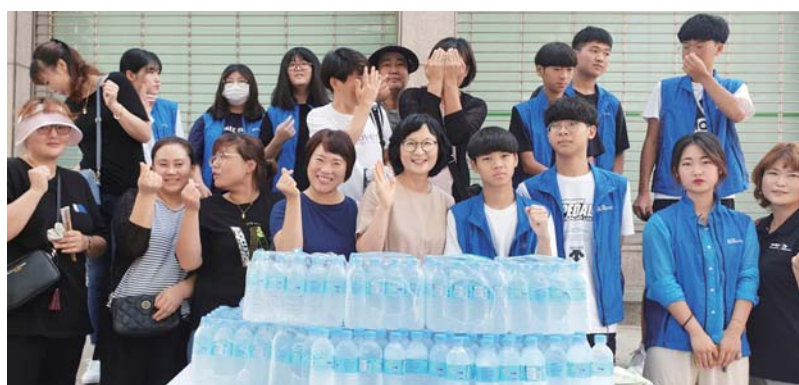
작은도서관 독서모임 ‘앵그리맘’ 열음생수 나눔 광주 광산구 우산동의 작은도서관 독서모임 ‘앵그리맘’ 회원 20여 명은 6일 우산매일시장에서 노점 상인과 시민들에게 열음생수를 나눠주며 건강한 여름나기를 응원했다.