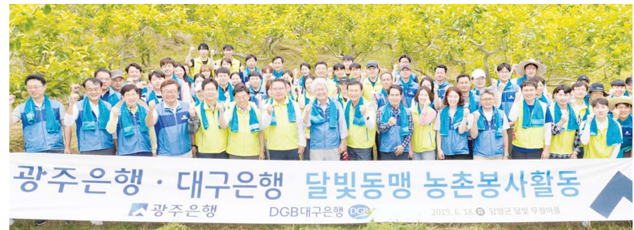
광주은행은 18일 오전 10시부터 담양에서 대구은행과 함께 농촌 일손돕기 봉사활동을 실시했다.

온라인쇼핑에서 주로 구매하는 품목으로는(복수 응답) 패션의류가 55.5%로 가장 많았고 식품·건강 제품(47.7%), 뷰티·화장품(36.2%), 생활·주방용품(35.4%), 신발·잡화(31.9%) 순이었다.