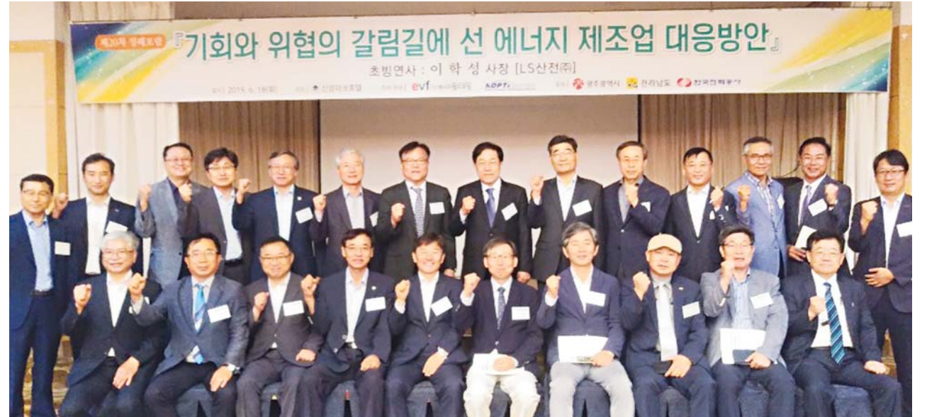
에너지밸리포럼은 한국광기술원과 공동으로 18일 오전 7시 한국전력공사, 한전KDN, 협력사 및 에너지 관련 기업과 기관, 관계자 150여 명이 참석한 가운데 신양파크호텔에서 ‘제20회 정례포럼’을 개최했다.

특히 이사장은 이렇게 급변하는 4차 산업혁명시대에 대응하기 위해서 “기존의 기술들을 서로 연결하고 융합하여 고객에게 새로운 가치(서비스)를 제공해야 하는 제품, 산업, 역할에 대한 재정의가 필요하며, 모든 활동들이 Smart Service 제공에 초점을 맞춰 서비스 중심으로 확장되어야 한다”고 기업체들의