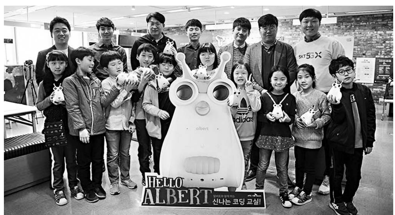
SKT, ‘T스마트폰 교실’ 수강생 2000명 돌파 SK텔레콤은 전국 300여개의 T월드 매장(공식인근대리점)에서 시행 중인 ‘알기 쉬운 T스마트폰 교실’ 누적 수강생이 프로그램 시작 5개월 만에 2,000명을 돌파했다고 18일 밝혔다. SK텔레콤은 올해 내로 ‘신나는 코딩 교실’을 전국 주요 도시의 10여 개 지점으로 확대 운영할 계획이다.

한콘진은 지난달 15일 네이버와 ‘대중음악 온라인 홍보지원 사업 협력’을 위한 업무 협약을 체결했다. ▲바이브(Vibe) ▲뮤지션리그 등 네이버 음악 플랫폼을 활용해 뮤즈온에 참여한 뮤지션의 대중 노출 기회를 확대할 계획이다. 또한 성공적 제작을 위한 멘토링 기회도 주어진다. 멘토에는 ▲세계에서 인정받는 글로벌 EDM DJ 히치하이커 ▲국민 발라드 그룹 스위트소로우의 김영우 ▲합합의 대부 래퍼 MC 메타 ▲한국 대중음악의 살아있는 전설 기타리스트 한상원 등 각 장르의 거장 아티스트들이 참여해 뮤지션들의 성장을 이끌 예정이다. 3라운드 진출 팀 중 파이널 콘서트와 종합평가를 통해 최종 선발된 다섯 팀은 또다시 ‘뮤즈온 TOP 콘서트’에서는 기회를 얻게 되며, 총 1억원 규모의 상금을 받는다. /송수영 기자