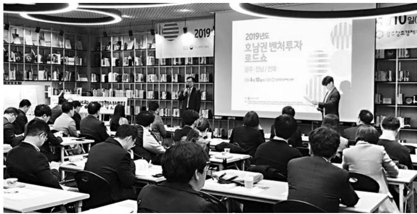
중기지방청이 지역 중소벤처기업의 혁신성장 자금 조달을 위한 '2019 호남권 벤처투자로드쇼'를 개최했다.

담을 통해 투자유치계획, 투자자금 조달 등 개별기업 맞춤 멘토링을 실시 했다. 이재홍 중기지방청장은 "투자 인프