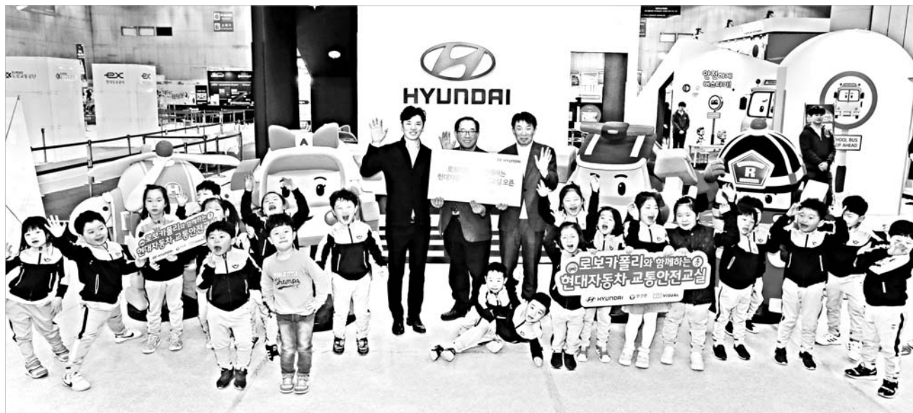
현대차 '로보카롤리' 활용 교통안전교실