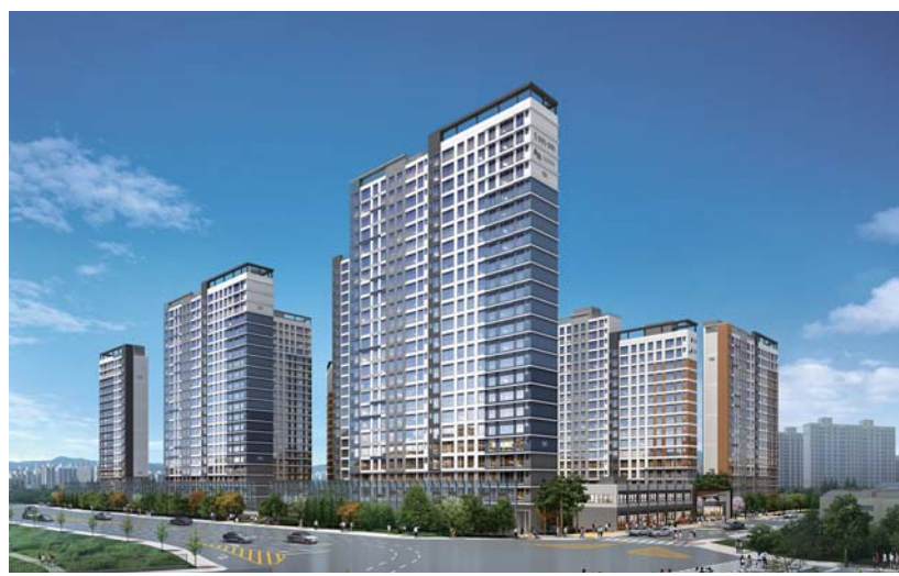
광주 임동2구역 ‘중흥S-클래스·고운라피네’ 투시도.

광주 북구 임동 2구역 ‘중흥S-클래스·고운라피네’ 일반공급이 오는 14일 시작된다. 12일 중흥건설에 따르면 고운시티아이와 공동 시공하는 ‘중흥S-클래스·고운라피네’는 지하 2층~지상 24층 9개동으로 들어선다. 공급 면적별로 ▲전용 39㎡ 56가구(임대) ▲전용 59㎡ 94가구 ▲전용 73㎡ 110가구 ▲전용 84㎡ 394가구 등 총 654가구 규모다. 이 가운데 일반공급은 437가구다. ‘중흥S-클래스·고운라피네’는 광주 지하철 1호선 양동시장역과 광주역이 가까워 접근성이 용이하다. 또 서림초·용봉초·북성중 등 다양한 학교들도 인접해 있다. 신세계백화점과 유스퀘어·NC백화점·천주의성요한병원, 중흥시장 등 풍부한 생활인프라도 으뜸이라는 평가를 받고 있다. 생활 공간은 남향 위주의 단지 배치로 일조권과 조망권을 최대한 확