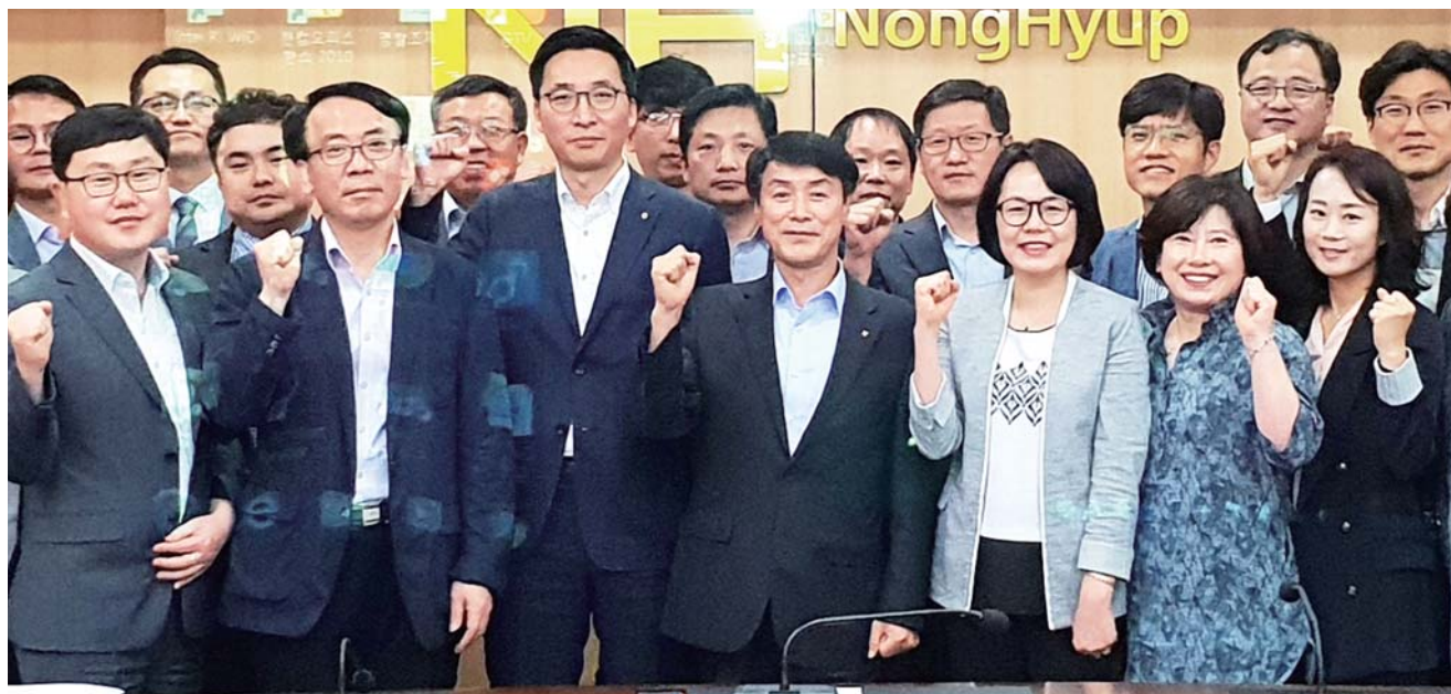
농협중앙회 전남검사국은 12일 내년 제 2회 전국동시 조합장 선거를 앞두고 공명선거실천 특별점검 발대식을 가졌다.

광주 상무지구 ‘유담 유블레스 트윈시티’가 12일 대한민국 토목건축기술대상에서 복합용 건축부문 우수상을 받았다. 올해로 14회째인 대한민국 토목건축기술대상은 최근 3년 동안 공사를 마친 토목시설물을 심사해 평가한다. 광주·전남 지역에서 유일하게 우수상을 받은 ‘유담 유블레스 트윈시티’는 광주 상무지구에 37층 330실 규모로 4베이(4-Bay) 혁신설계를 적용해 건설됐다. 유담 관계자는 “어려운 지역민들을 위한 사회공헌활동도 하고 있다”며 “지역 고성장 위해서도 다양한 활동을 하겠다”고 밝혔다. /김영민 기자