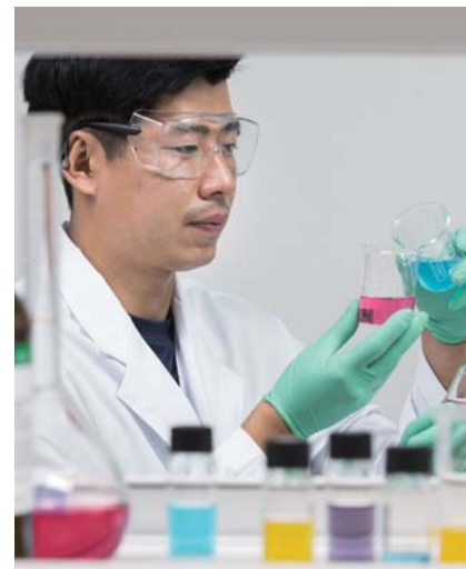
화진산업은 R&D를 위한 연구전담부서를 통해 친환경 필름 개발 성과를 특출히 거두고 있다.

또 자동화된 설비와 품질검사로 미세한 결함까지 확실히 품질력은 더욱 좋아지며 제품 불량률은 0%대까지 떨어졌다.