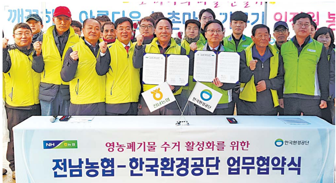
농협 전남지역본부 4일 영광에서 한국환경공단 호남권지역본부와 영농폐기물 수거 활성화를 위한 협약을 체결했다.

건설업은 -5.7%로 81분기 만에 가장 낮았다. 건물과 토목 건설이 모두 줄었다. 특히 건설업은 1년 전에 비하면 8.1% 역성장했다. 서비스업은 0.5% 성장했다. 여름 폭염 여파로 문화 및 기타서비스업(-1.7%)은 마이너스였지만 보건 및 사회복지서비스업이 4.8%였다. 3분기 실질 국민총소득(GNI·계절조정계열)은 전 분기보다 0.7% 증가했다. 국내총투자율은 29.3%로 1.7%포인트 하락하며 9분기 만에 최저치를 나타냈다. GDP 디플레이터는 작년 동기보다 0.1% 상승했다. 이는 2012년 4분기(-0.3%) 이래 최저였다. /김영민 기자