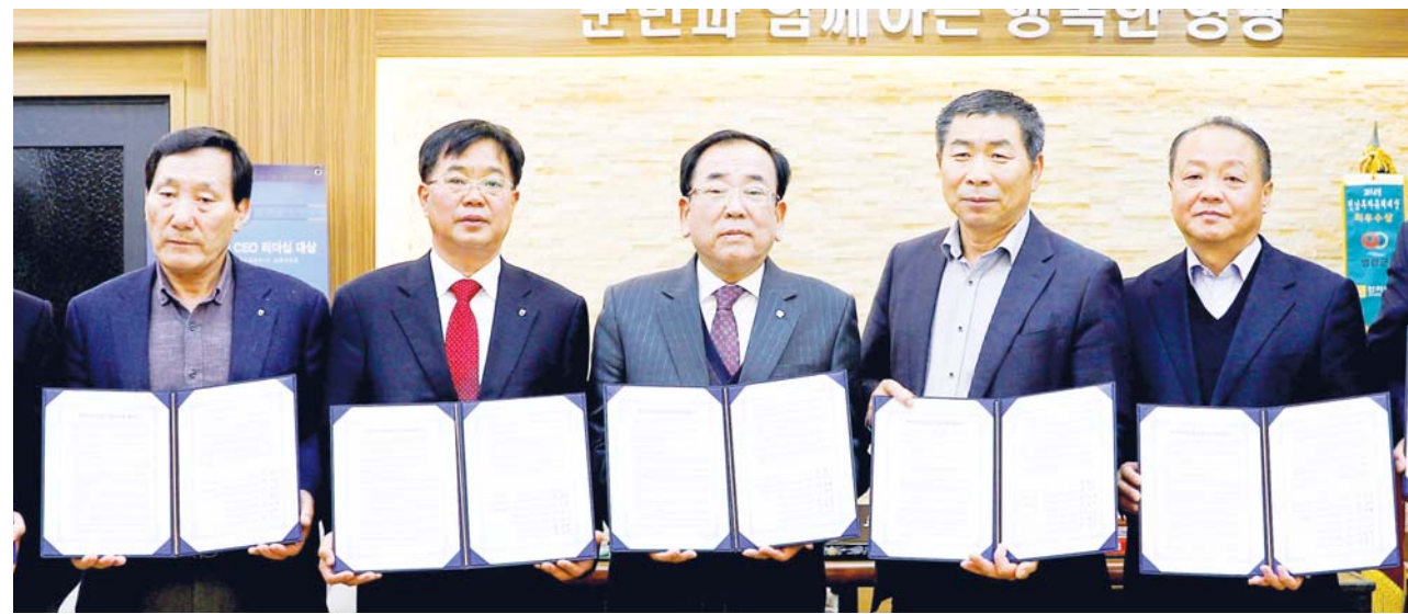
영광군은 최근 군청 회의실에서 NH농협 관계자와 영광사랑상품권 업무대행 협약을 체결했다.

군은 이번 협약을 통해 기존 23%에서 8.8%로 인하된 판매 수수료를 적용, 농·특산품 판로확대 및 소득향상에 기여할 것으로 기대하고 있다. /담양=장동원 기자