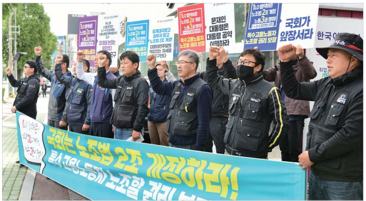
“특수고용자 노동3권 보장하라”

한 조사를 이어가고 있다. 동구는 특별감사와 전수조사 결과에 따라 해당 시설을 추가 고발할 예정이다. 국가인권위원회는 지난 7월 A보육원 원장이 2016년 1월 허락없이 쌍꺼풀 수술하고 귀가한 B양(당시 17세)을 정신병원에 강제 입원시키려고 시도하는 등 아동학대 사실을 확인하고 원장을 징계할 것을 권고했다. 원장은 과거에도 ‘품행장애’를 이유로 초등학교 4명과 중학생 1명을 정신병원에 입원시킨 것으로 인권위 조사에서 드러났다. 하지만 권고를 받은 지 두 달이 지나도록 후속 조치가 이뤄지지 않자 B양은 상담기관의 도움을 받아 원장을 고발했고, 경찰은 전수조사 등 수사에 착수했다. /이나라 기자