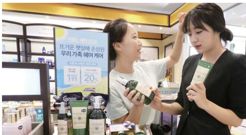
백화점 매장내 특정공간에서 한시적으로 운영하는 팝업스토어가 홍보와 판매 개념을 넘어 최신 트렌드를 고객들에게 제시하는 역할까지 하고 있다.

릇으로 알려진 '수타미'는 지난해 생활부분 대형행사에서 상당한 매출을 올린 것을 시작으로 지난해 지하 1층에서 비 정기적으로 팝업스토어를 열었다. 이후 고객들의 구매문의가 계속 이어지면서 마침내 올해 2월 생활매장에 정식으로 입점해 큰 인기를 끌고 있다.