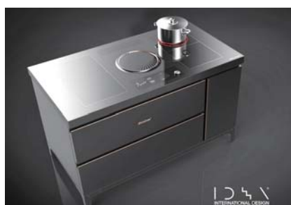
퍼니처 타입 김치냉장고(위)와 쿱탑 타입 김치냉장고.