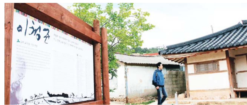
장흥군 회진면에 위치한 이청준 생가.

6일 오전 10시에는 회진면 진목리 문학자리에서 지역 문학단체들이 작가의 소설을 낭송하고 추모시를 지어 문학제의 행간을 재운다.