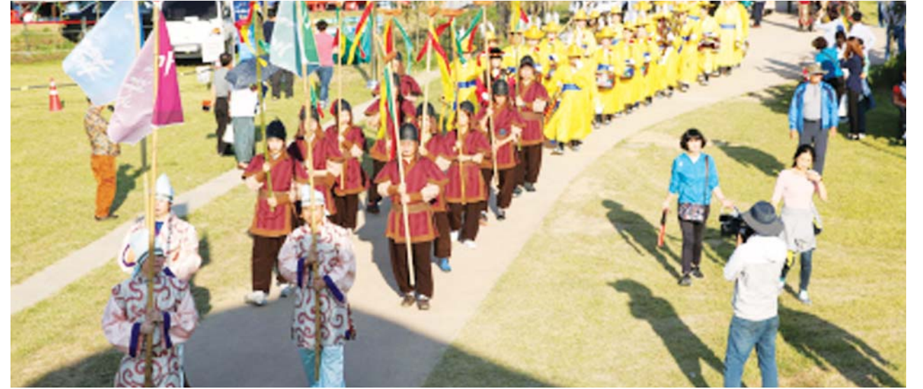
나주시는 오는 19일 '마한, 새로운 천년을 열다!' 라는 주제로 국립나주박물관 일원에서 제4회 마한문화축제를 연다. 사진은 지난해 축제 모습.

신규 프로그램으로는 지역 농특산물을 방문객이 직접 구워먹는 원시바비큐 체험, 마한시대 유물을 활용한 마한 보물찾기, 문화재 출토체험 등 16종의 체험 프로그램을 구성했고,