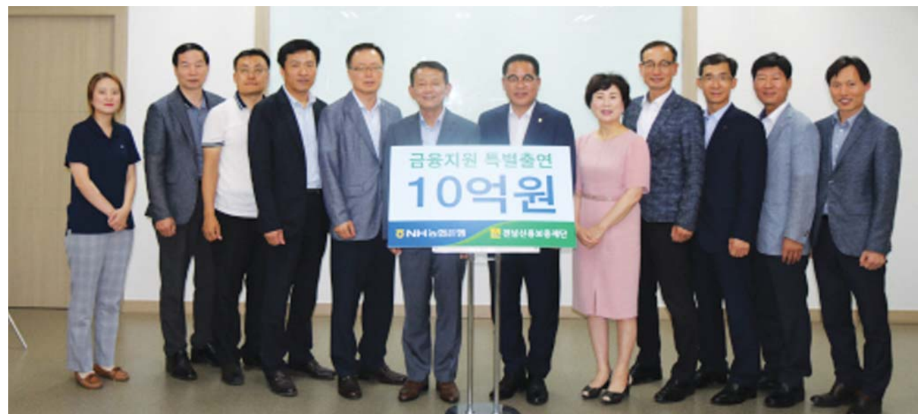
전남신용보증재단과 농협은행은 최근 재단 본점에서 '전남 소기업·소상공인 금융지원 업무협약'을 체결하고, 농협은행 특별출연 협약보증을 추가 지원하기로 했다.