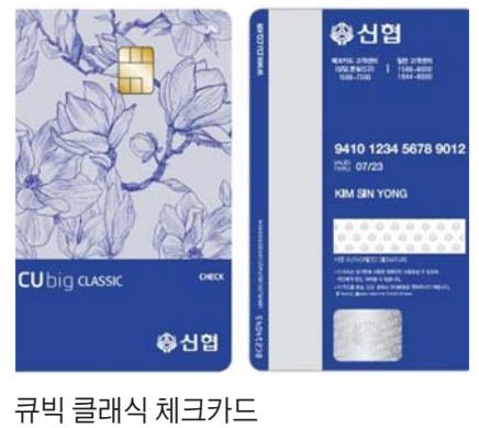
큐빅 클래식 체크카드

앞으로 저축은행이나 카드사, 캐피탈사가 대출 상품을 광고할 때는 대출 이용 시 신용등급이 하락할 수 있다는 경고 문구를 포함해야 한다. 금융위원회는 지난 14일 국무회의에서 이 같은 내용의 상호저축은행법과 여신전문금융업법 시행령을 각각 개정했다. 저축은행법 개정안에 따르면 저축은행은 대출 상품을 광고할 때 신용등급 하락 가능성과 신용등급 하락 시 금융거래 관련 불이익이 생길 수 있다는 경고 문구를 포함해야 한다. 또 대부업자가 자회사를 통해 저축은행을 설립·인수할 경우 직접 설립·인수할 때와 같이 대부자산 감축 등의 요건을 적용하기로 했다. 대부업자에 대한 신용공여 한도도 신설해 저축은행이 대부업자에 대출해주는 돈이 전체 대출액의 15%를 넘지 못하도록 규제하기로 했다. 이번에 국무회의를 통과한 저축은행법 시행령과 여신전문금융업법 시행령은 오는 21일 공포 후 즉시 시행된다.