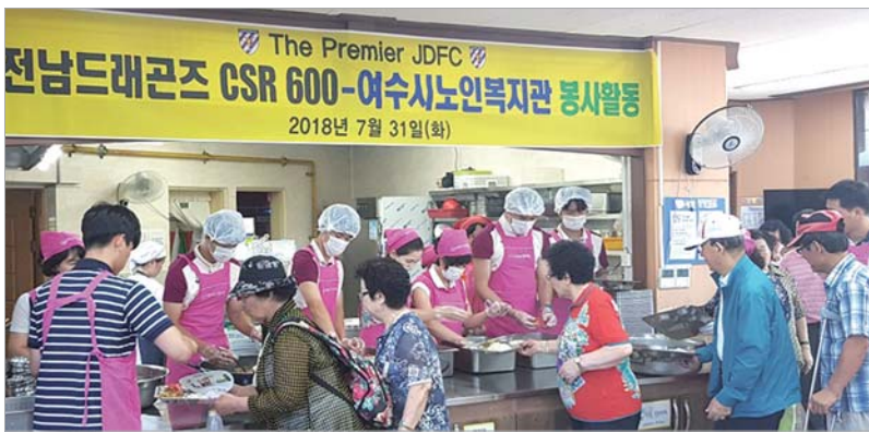
전남드래곤즈, 사랑의 배식 봉사

남 회장은 “봉사활동은 본인이 하지 않는다고 해서 사라지는 것은 아니지만 누군가는 해야만 하는 일이라고 생각한다”고 말한 뒤 “주변을 돌아보고 자신이 할 수 있는 작은 실천을 옮기는 게 봉사의 시작이다”고 당부했다. /김중찬 기자