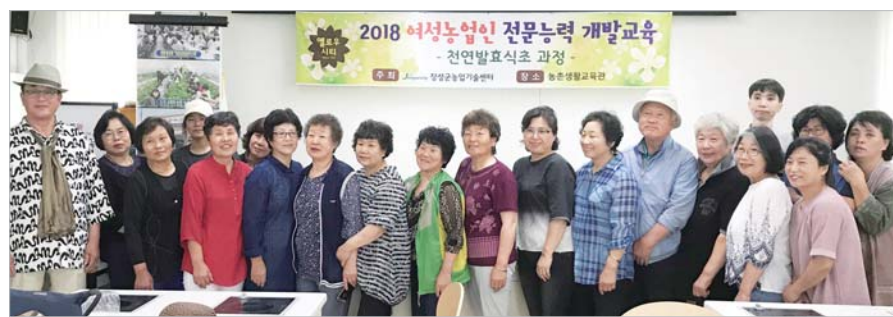
장성 여성농업인, 가공식품 자격시험 ‘전원 합격’

조선대학교 미술대학은 베트남 호치민시립미술대학과 오는 3일까지 조선대 미술관에서 교수 교류전을 연다.