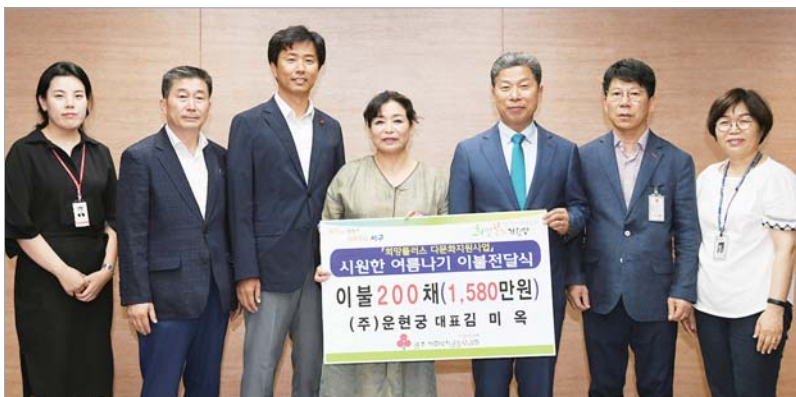
㈜운현궁, 서구청에 이불 기탁

지난달 31일 광주시 광산구 수완동 임방울대로에서 지역 건설현장 책임 건설사들이 ‘폭염대응 공사장 살수차 운행 발대식’을 가졌다.