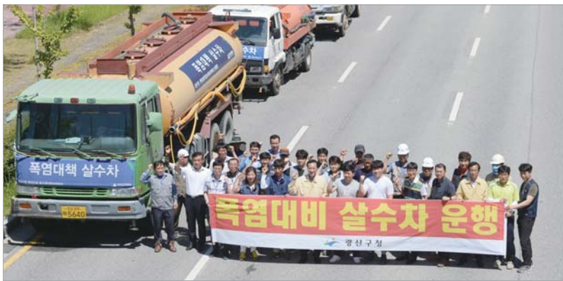
광산, 폭염대응 살수차 발대식