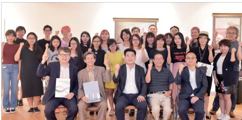
조선대 미술대학, 호치민 시립미술대와 ‘교수 교류전’