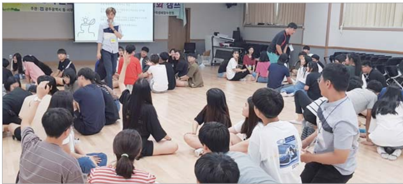
광주시교육청, 중등 학생자치의회 역량강화 캠프