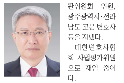
판위원회 위원, 광주광역시·전라남도 고문 변호사 등을 지냈다. 대한변호사협회 사법평가위원으로 재임 중이다.

광주지방변호사회 제48대 회장, 사법제도 개혁추진위 실무위원, 광주 행정심