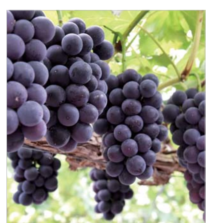
장성 삼서면에서 생산되는 자옥포도.

장성군 농업기술센터 관계자는 “농가의 소득 증대를 위해 포도의 수급 조절로 가격안정화를 도모하고 있다”며 “농업인들의 고소득에 기여하기 위해 포도 소비 활성화 사업을 기획했다”고 설명했다. /장성=전일용 기자