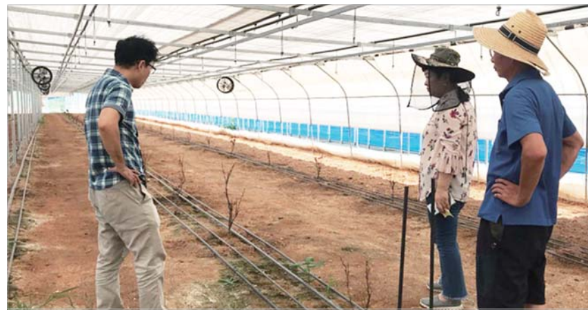
중부권 지자체들이 폭염 농작물 현장 기술지원에 나섰다. 사진은 나주시 농가기술지원단의 발작물 점검 모습.

수기를 이달 10일 전후로 예측했다. 이에 따라 잎집무늬마름병, 이삭도열병, 세균성벼알마름병, 벼 맥노린재, 벼멸구 등의 병해충 종합방제가 필요한 것으로 판단하고 있다.