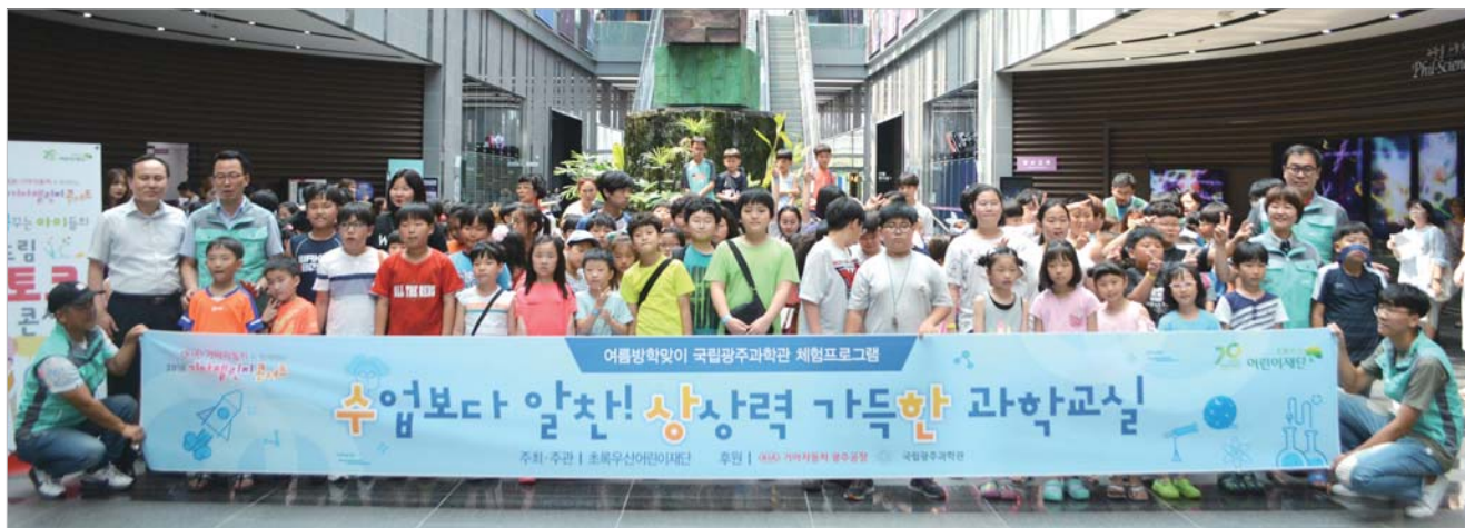
기아차 광주공장은 8일 국립광주과학관에서 '수업보다 알찬! 상상력 가득한 과학교실'을 개최했다.

냉면 가격이 한 그릇 평균 8,808원으로 지난해 같은 달(8,038원)보다 9.6%(770원) 뛰는 등 서민들이 주로 찾는 외식 메뉴 8개 가운데 7개 가격이 지난 1년간 올랐고 1개만 변동이 없었다. /김윤현 기자