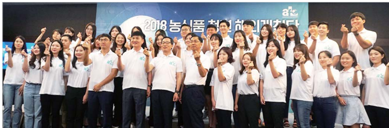
농수산식품유통공사는 최근 '농식품 청년 해외개척단 5기' 발대식을 가졌다. 농수산식품유통공사는 브라질, 폴란드, 대만, 말레이시아 등 주요 거점 9개국에 개척단을 파견해 시장다변화 프런티어 업체의 현지 주재원 역할을 수행한다.