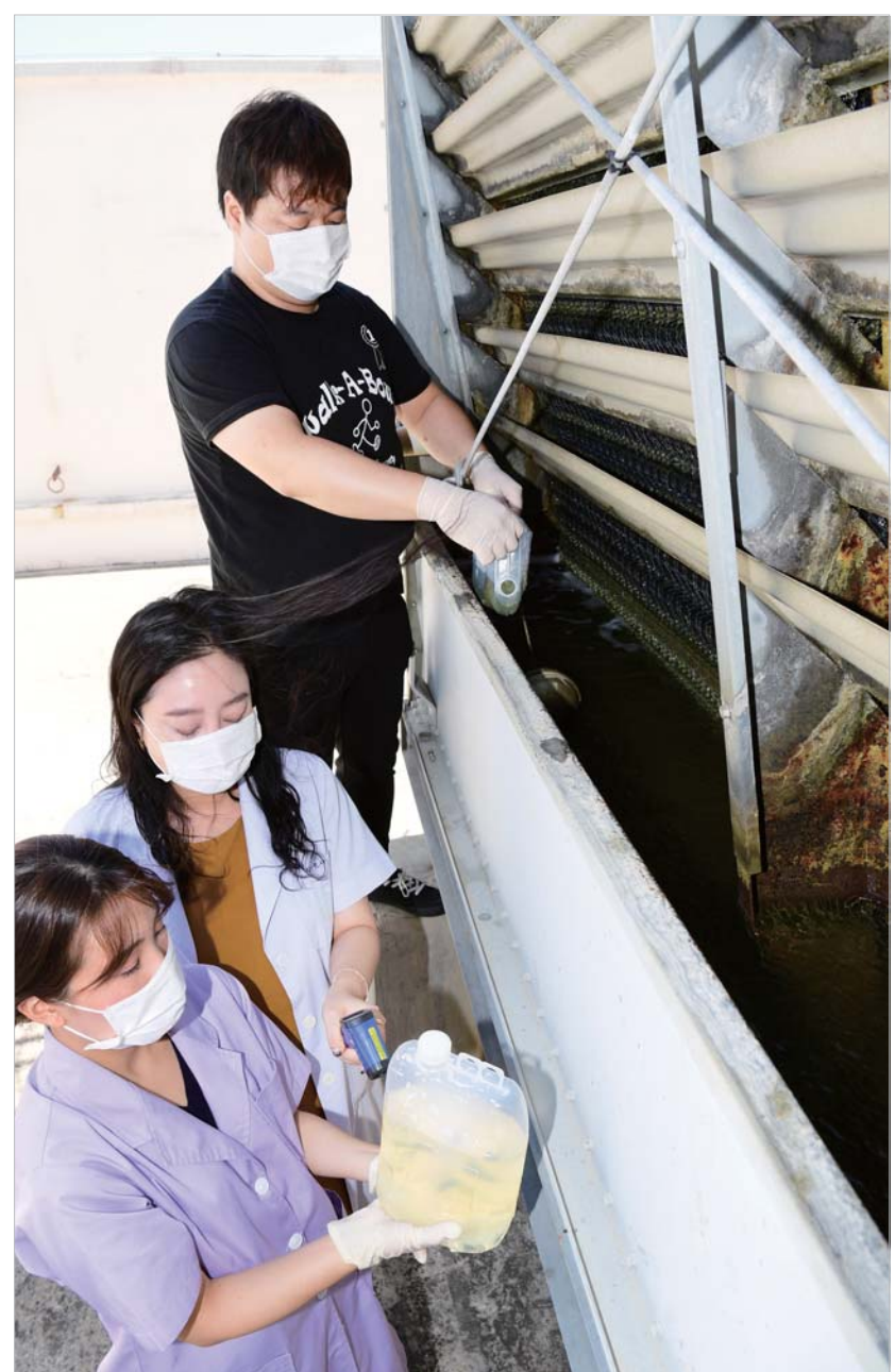
냉각탑 수질검사 연일 이어지는 폭염으로 에어컨 사용이 급증하고 있는 가운데 1일 오전 광주시 서구보건소 관계자들이 여름철 냉방기 사용으로 감염 될수 있는 레지오넬라증 감염예방을 위해 관내 한 빌딩 냉각탑에서 냉각수를 담고 있다.