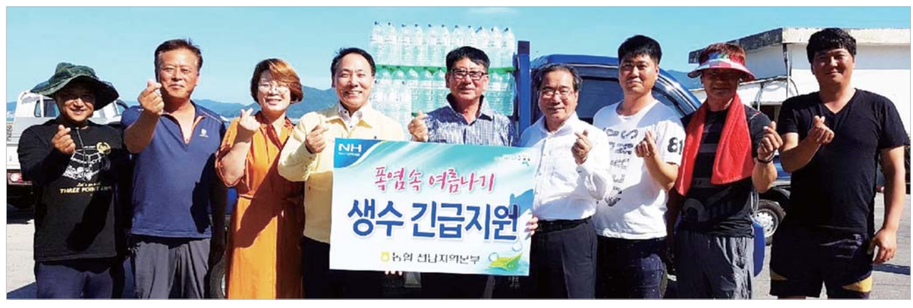
농협 전남지역본부와 완도농협은 완도 노화도, 넓도 지역을 방문해 주민에게 생수를 지원했다.

7월 비제조업 업황 BSI는 68로 전월 대비 3포인트 하락했으며, 8월 업황 전망 BSI도 69로 2포인트 떨어졌다. 비제조업 매출 BSI는 80으로 전월보다 2포인트 상승했으나, 8월 매출 전망 BSI는 78로 전월보다 1포인트 하락했다. 비제조업의 경영애로사항은 인력난 및 인건비상승, 내수부진, 경쟁심화 등의 순으로 조사됐다. /조기철 기자