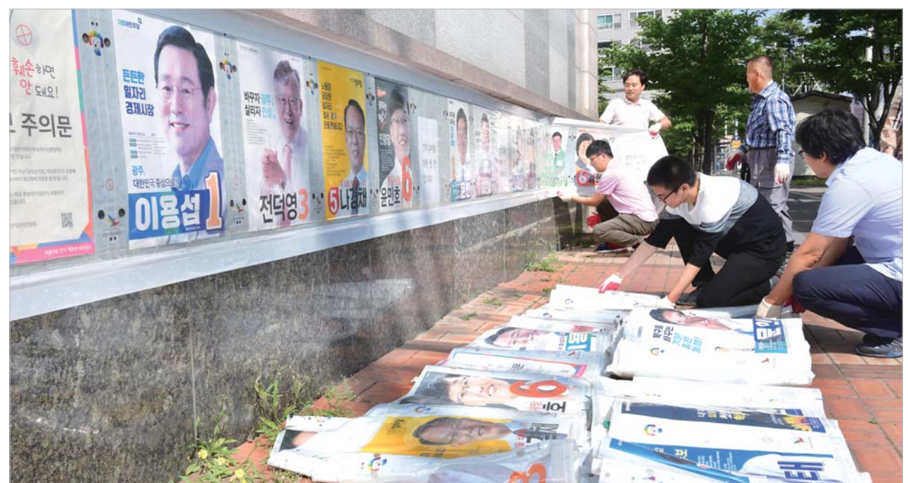
선거벽보 철거 14일 오전 광주 북구 운암동에서 주민센터 직원들이 선거벽보를 수거하고 있다.