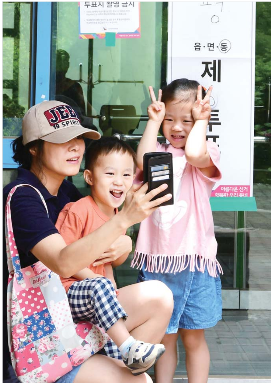
하나 둘 셋~인증샷 투표를 마친 한 가족이 치평동 제6투표소 입구에서 인증샷 촬영을 하고 있다.