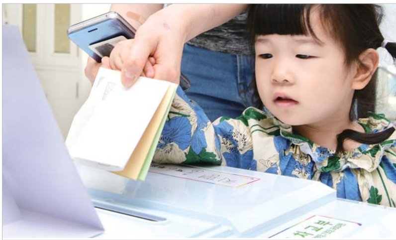
미래의 유권자 가족과 함께 투표소에 온 미래의 유권자가 어머니와 함께 투표용지를 투표함에 넣고 있다.