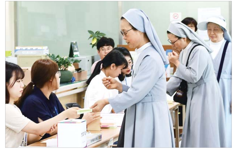
수녀님들도 한표 송암동 주민센터에서 수녀들이 투표를 하기 위해 본인 확인 후 투표용지를 교부받고 있다.