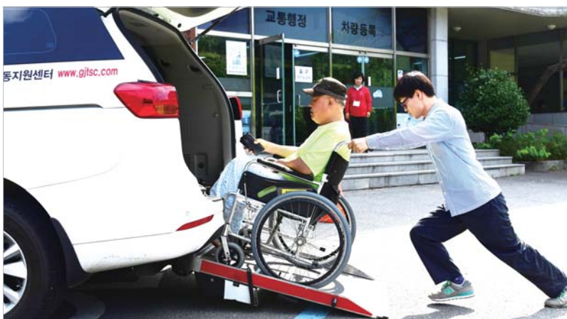
아픈몸을 이끌고 병원에 입원중이던 한 유권자가 이동지원센터의 도움으로 송암동 제1투표소에서 투표를 하고 돌아오고 있다.