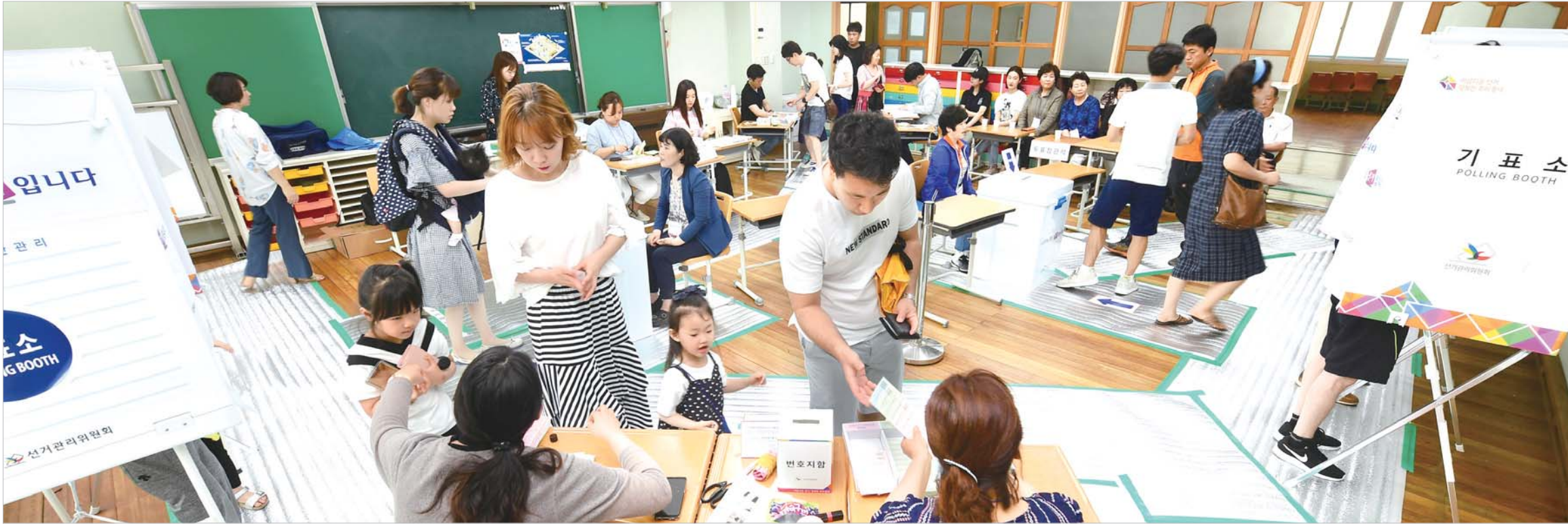
투표용지도 꼼꼼히 챙기고 제7회 전국동시지방선거일인 13일 오전 광주시 서구 치평동 제6투표소가 마련된 계수초등학교에서 유권자들이 순조롭게 투표를 하고 있다.