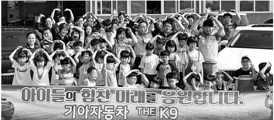
기아차 전남지역본부는 최근 목포아동원을 찾아 어린이들과 함께 영화를 보고 드라이브도 하며 즐거운 시간을 보냈다.

한국전력(사장 김종갑)은 국민들과의 다양한 소통채널을 확보하고 상시적으로 고객 의견을 수렴해 전력서비스에 반영하기 위해 'KEPCO 온라인 국민소통패널단'을 모집한다고 10일 밝혔다. 패널단은 다음달부터 12월까지 고객 의견 수렴이 필요한 한전의 각종 전력서비스와 제도에 관한 온라인 설문조사에 응답하고, 아이디어를 제공하는 활동을 펼친다. 한전이 올해 처음으로 모집하는 패널단은 전력서비스에 관심이 있으며, 온라인으로 진행되는 여론조사에 참여가 가능한 일반국민(만 19세 이상)이면 누구나 지원할 수 있다. 총 600명을 모집하며, 희망자는 응모기간인 오는 27일까지 한전 홈페이지(home.kepco.co.kr)와 사이버지점 공지사항 등을 통해 지원서를 온라인으로 제출하면 된다. 패널단 활동이 종료되면 일정 수준의 활동을 한 패널들에게 소정의 상품권을 지급하고, 활동 우수자에게는 에너지신사업 등 현장견학 기회도 제공할 예정이다. 한국전력 김종갑 사장은 "이번 온라인패널단 모집을 통해 국민의 소리에 더욱 귀를 기울이겠다"며 "한전이 그동안 생각하지 못했던 내용을 반영해 서비스를 더욱 개선할 수 있는 기회가 되기를 바란다"고 말했다.