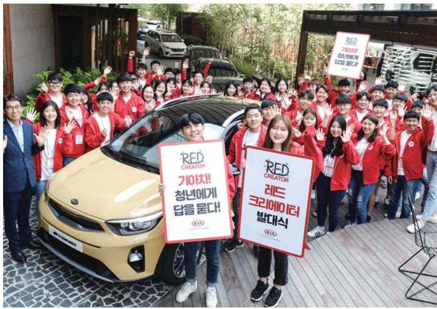
기아자동차는 최근 대학생 싱크탱크 프로그램 ‘레드 크리에이터’ 출범식을 갖고 고객들의 특색 튀는 아이디어를 자동차 개발에 활용할 방침이다.