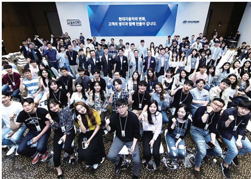
현대자동차는 최근 ‘H 옴부즈맨’ 3기 발대식을 갖고, 고객의 다양한 의견을 듣는 ‘고객 소통 프로그램’을 펼치고 있다.