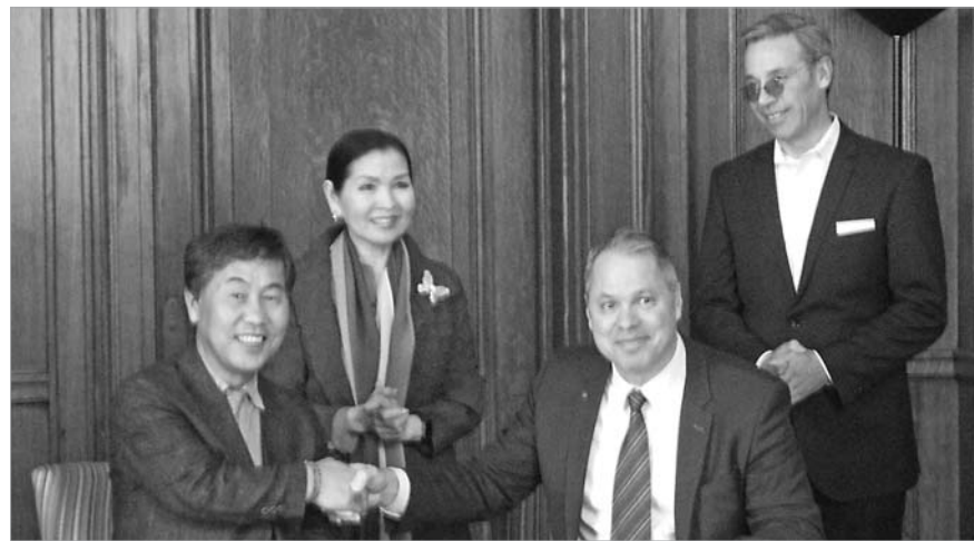
(재)나주시천연염색문화재단은 최근 미국 메릴랜드 인스티튜트 컬리지 오브 아트와 천연 염색 교류 발전을 위한 업무협약을 체결했다.

나주천연염색문화재단과 업무협약을 맺은 MICA는 워싱턴, 볼티모어 지역을 대표하는 예술대학으로 유에스뉴스월드 리포트(U.S. News & World Report)