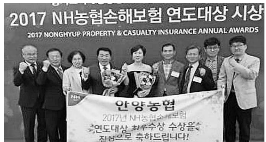
장흥 안양농협은 최근 서울 더케이호텔에서 열린 '2017 NH농협 손해보험 연도대상 시상식'에서 대상을 수상했다.

김명원영광 부군수 는 26일 오전 8시 10분 부군수실에서 실과소장간담회를 갖는다.