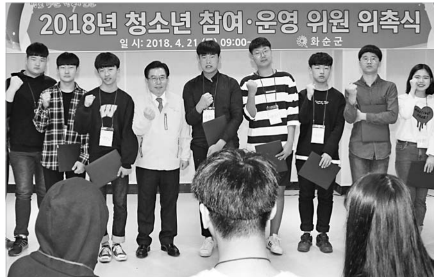
화순군은 최근 청소년 청소년 참여위원 15명과 청소년문화의 집 운영위원 15명을 위촉했다.

위원회는 위촉식에 이어 정기 총회를 갖고 청소년이 살기 좋은 지역사회 변화 프로젝트를 목표로 향후 운영과 활동일