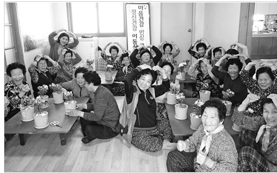
함평군보건소는 지역 경로당에서 ‘찾아가는 정신건강 이동상담실’을 실시했다.

부암 세포 증식 억제 및 각종 성인병 예방에 탁월한 효과를 발휘하는 유용성 성분인 알부틴, 클로로겐산, 말라시닌산 등이 다량 함유돼 있다. 특히 이날 심포지엄에서 전남대 문제학 교수는 “기존에 활용성을 발굴하지 못해 대부분 폐기되어 왔던 배 미성숙과에 유용 향산화 화합물이 성숙과보다 다량 함유되어 있다”고 연구 결과를 밝혔다. 문 교수에 따르면, 미성숙과에 함유된 알부틴, 클로로겐산 등 화합물을 대량 고순도로 정제하는 기술을 지역산업체에 이전, 현재 화장품 소재로 활용하고 있으며, 미성숙과, 비상품과를 이용한 음료 개발, 동결건조를 통한 가공식품 등을 개발·유통하고 있다. 또 배나무 전정가지에서도 유용성 화합물이 다량 함유된 것으로 나타나, 지속적인 연구·개발을 통한 배 농가의 부가가치 창출이 기대된다. 나주시 관계자는 “이번 설명회를 통해 나주 배 미성숙과, 전정가지, 작점박의 유용성에 대한 과학적 근거가 제시된 만큼 배 부산물을 농가소득증대로 실용화할 수 있는 연구·개발을 지속해갈 계획”이라고 밝혔다. /나주=이재순 기자