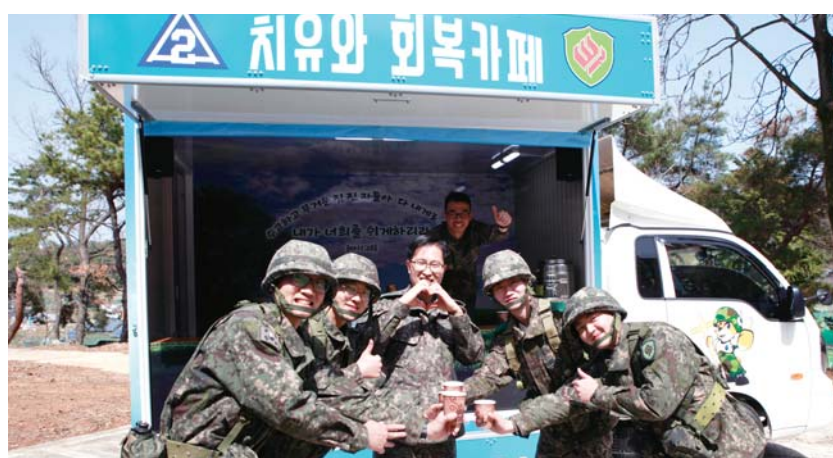
31사단은 22일 치유와회복카페트럭기증식을 가졌다. 이 카페트럭은 1t 트럭에 커피머신, 음향장치, 자가발전 장치 등을 설치한 것으로, 군선교연합회 대경지회 후원으로 제작됐다.

이날 공개된 ‘치유와 회복 카페트럭’은 1t트럭을 전문업체를 통해 카페트럭으로 개조하고, 차량내부에 커피머신, 음악 등 방송을 위한 앰프, 전기식 냉·보온병, 220V 전원 및 자가발전 장치를 설치했다.