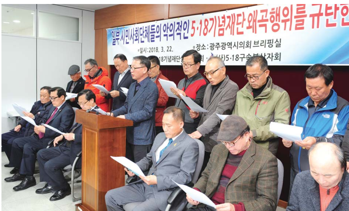
5·18기념재단설립동지회와 5·18구속부상자회가 22일 오후 광주시의회에서 기자회견을 열고 일부 지역 시민단체가 악의적으로 5·18기념재단을 흔들고 있다며 공개토론을 통해 문제 해결을 하자고 촉구했다.

남여성단체연합, 광주진목예술단체 총연합, 광주진보연대가 주장하고 있는 성명서 내용의 근거와 진실, 기념재단의 발전방향에 대해 논의할 수 있는 공개토론을 열자”고 제안했다.